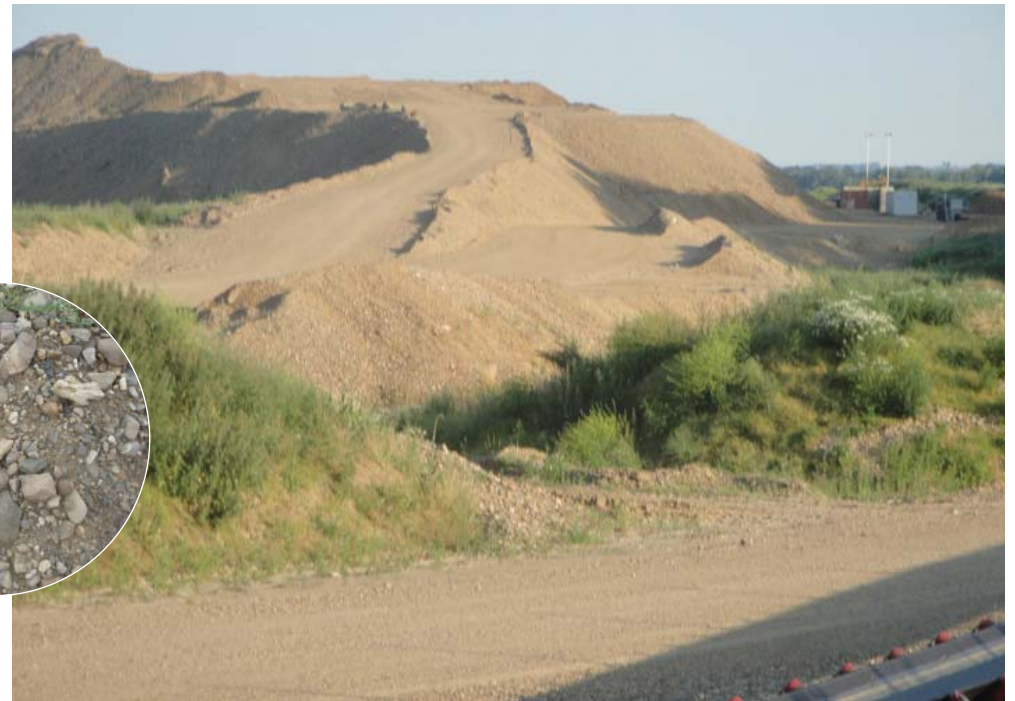
Grindwinning in Rotem.