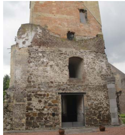
Oude Toren van Dilsen.